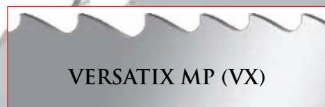
VERSATIX MP (VX)

Революционное новое исполнение зубьев, приводящее к сильному увеличению прочности зубьев, особенно предназначенное для прерывистого резания конструкционных материалов.